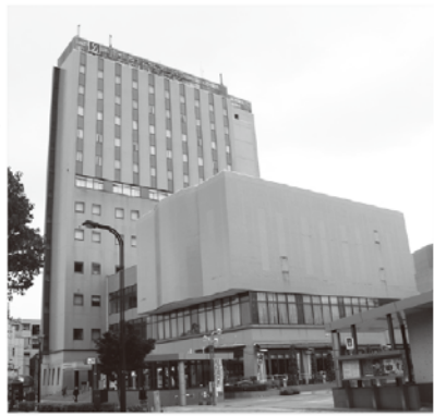
仙台サンプラザにある東北こども福祉専門学院

がら学び、資格を取得できる専門学校として入学希望者も年々増加、特に男性の入学者が増加傾向にあるという。